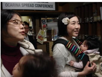
3号では林楽器商会を取材。取材でなければ出会えない社長さんの話に感動！