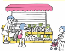
軒下をお店化する!?