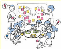
お勧め商品の試食会

「いまある商店街の豊かさを、子ども達にも残したい」――。 「私たちが持つ小さな力を集めることで、商店街のお役に立てないかな？」 昨年末には「親子で街デビュー」に参加した母たちが再集結。育児中のいまある時間を活用して、親子と商店街がコラボしてできる活性化アイデアを話し合いました。 「座談会形式でお店の商品の試食会があったら楽しいかも!」「お店の商品を使ったレシピコンテストなんてどう?」――ちょっとしたアイデアで、私たちが発見した商店街の魅力を多くの人々に伝えられそうな予感です。